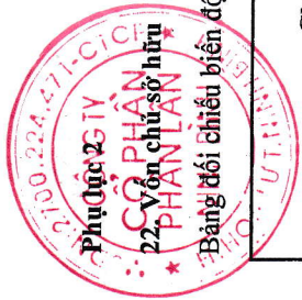
Bảng đối chiếu biến động của vốn chủ sở hữu